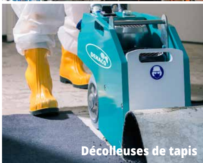
Décolleuses de tapis