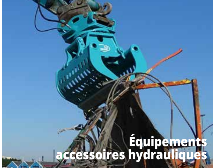
Équipements accessoires hydrauliques