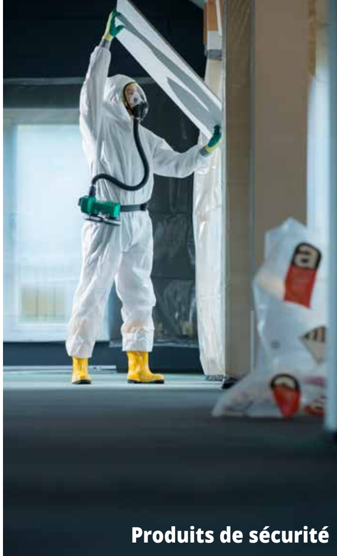
Produits de sécurité